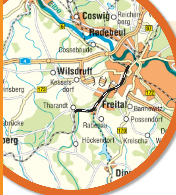
Im Tal der Wilden Weißeritz

Im Übrigen befindet sich inmitten des großen Waldstücks, an der »Diebeskammer« des legendären Räuberhauptmanns Lips Tullian, der geografische Mittelpunkt Sachsens.